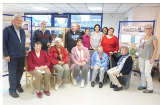
Vernissage de l'exposition à la bibliothèque

Début octobre, des résidents se sont rendus à la bibliothèque municipale pour l'inauguration de l'exposition mettant en lumière les anciens commerces de la commune.